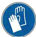
Gants à usage unique EN374