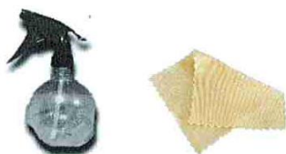
Lingettes pré imprégnées ou Papiers à usage unique + pulvérisateur