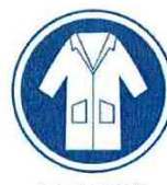
Blouse de travail habituelle