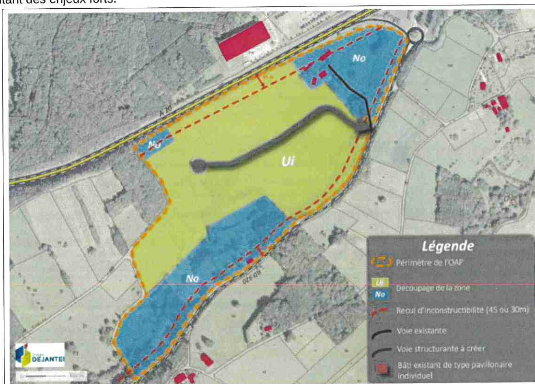
Orientation d'aménagement et de programmation

L'orientation 4 de l'orientation d'aménagement et de programmation (OAP) préconise d' « intégrer les éventuels bassins de rétention suivant ainsi la topographie et le fonctionnement naturel du terrain » le long de la RD.920, sans préciser la largeur concernée par cette disposition. À défaut d'un classement de cette partie de la zone en zone naturelle No, qui serait de nature à préserver de manière pérenne ces espaces et permettrait un classement homogène du ruisseau, la MRAe recommande de compléter la partie graphique de l'OAP afin de protéger les milieux humides bordant la RD.920 en faisant apparaître les surfaces présentant des enjeux forts.