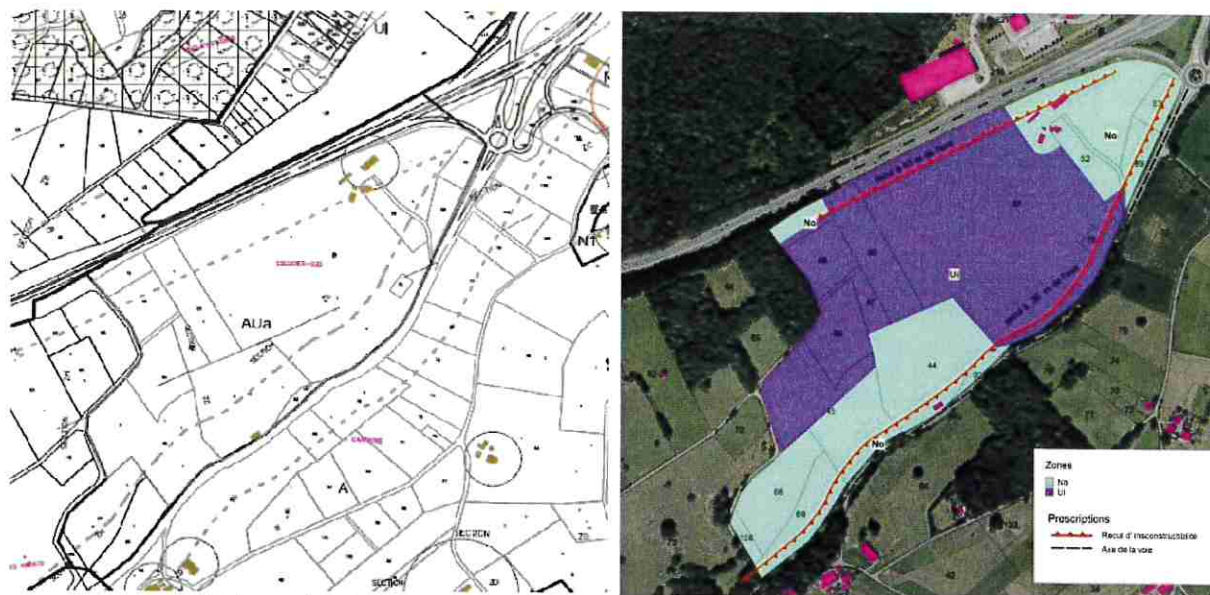
Plan de zonage du PLU 2006 Plan du nouveau classement 2018 Règlement graphique du PLU avant et après révision allégée